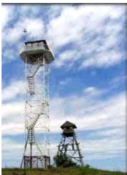
Slika 2 Osmatračnica sa video kamerom na području Deliblatske peščare Picture 2 Observation with a video camera in area of Deliblato sands

Ovi sistemi koriste najsavremenija dostignuća u vidu kamera, kompjuterske tehnologije te meteoroloških podataka koje integrišu u jednu celinu. Imajući u vidu ovakve napredne sisteme za praćenje terena i rano otkrivanje požara, te procenu njegovog širenja, preventivne mere zaštite od požara su dobile jednu sasvim novu dimenziju za sprečavanje nastanka i širenje šumskih požara.