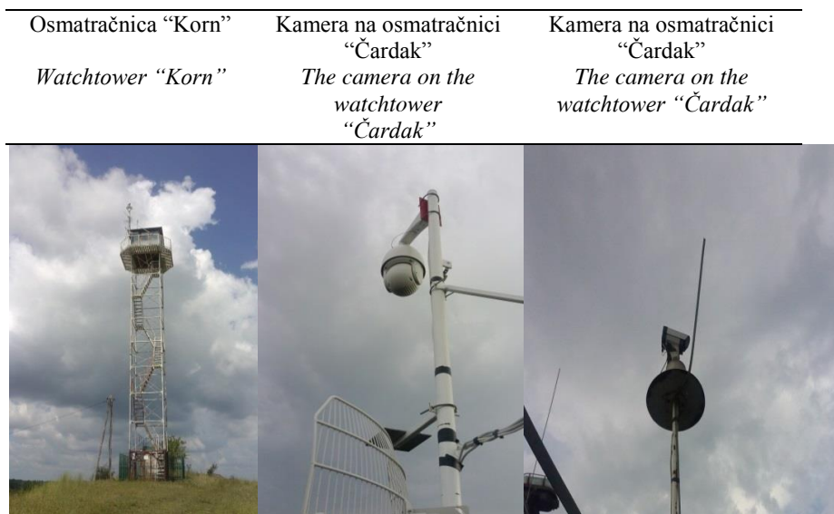
Slika 3 Osmatračnica i sistem kamera Figure 3 Watchtower and camera system

Kamere imaju mogućnost horizontalne rotacije od 360^{\circ} , a vertikalne od 80^{\circ} . Na svakoj kameri odnosno pri njenom postolju je instaliran uglomer kako bi se moglo očitati u kom pravcu kamera snima područje.