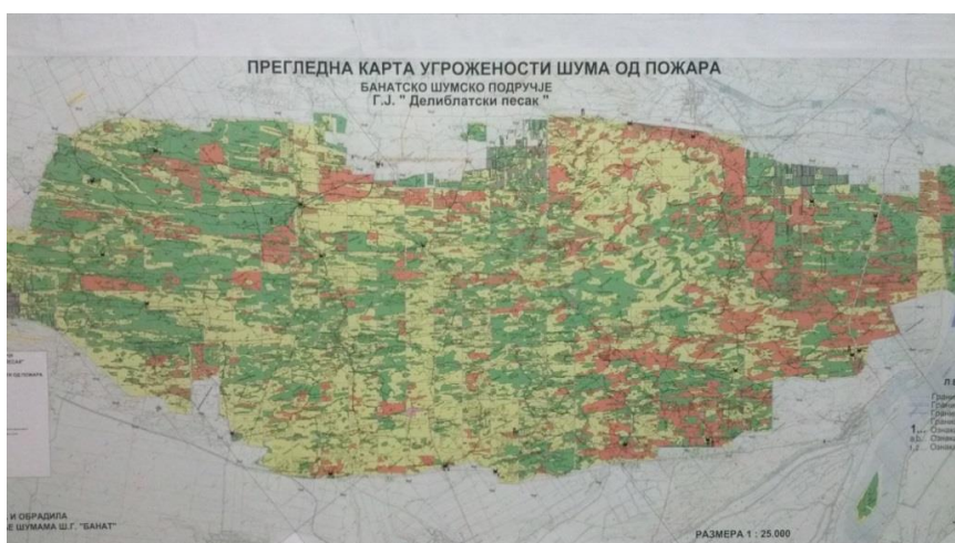
Slika 1. Pregledna karta ugroženosti šuma od požara Figure 1. Overview map of threat from forest fires

Na istraženom području preovladava šumska vegetacija, odnosno sastojine bora i ariša, i ostalih lišćara, mešovite sastojine četinarara i lišćara, sastojine lišćara: bagrem, hrast, lipa i ostali lišćari, kao i žbunasta i travna vegetacija, te požarišta. Prema samoj strukturi šumskih vrsta ali i čistina može se konstatovati da je ovo područje veoma podložno izbijanju požara, posebno u sušnim periodima sa puno gorivog materijala i visokim temperaturama.