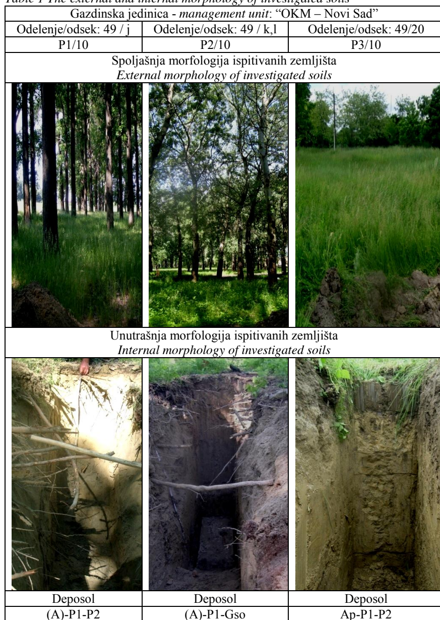
Tabela 1 Spoljašnja i unutrašnja morfologija ispitivanih zemljišta Table 1 The external and internal morphology of investigated soils